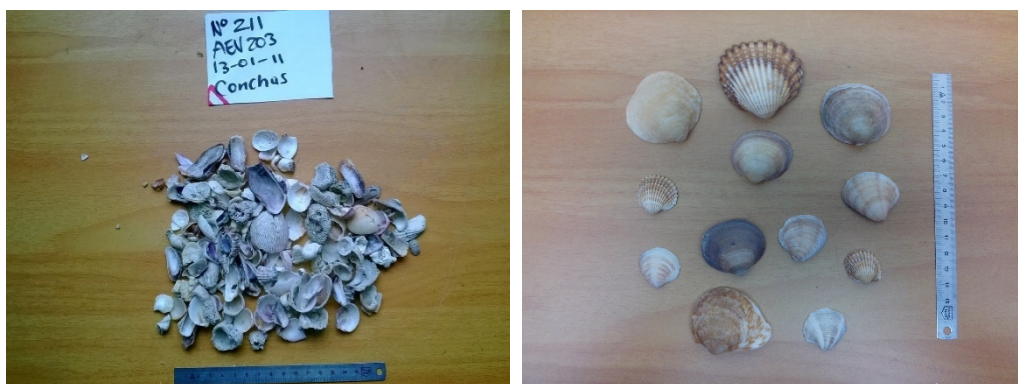
Fotografías 8-9: Especímenes de la Clase Bivalvia.

Resulta pertinente destacar que estos géneros tienen presencia en aguas jurisdiccionales colombianas, particularmente en el Océano Atlántico por lo que la distribución geográfica de estas especies corresponde con nuestro mar Caribe y, por tanto, realizar la reintroducción en esta zona, es técnicamente viable.